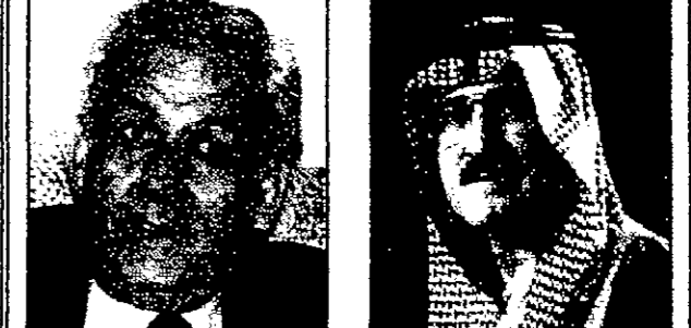
الأمير سلطان بن عبد العزيز